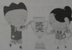
說明：學生榮譽制度健康促進獎勵項目

*各處室舉辦之相關活動、競賽，依各處室擬定之活動計畫，給予相對之榮譽卡或積點卡以茲鼓勵。