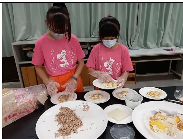
教師節活動-珍愛我的食尚老師 小小廚師製作營養三明治