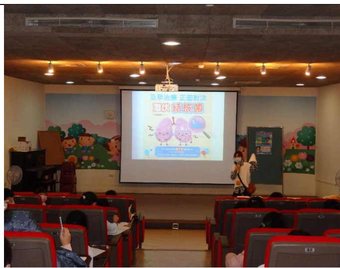
歸仁衛生所衛生教育宣導