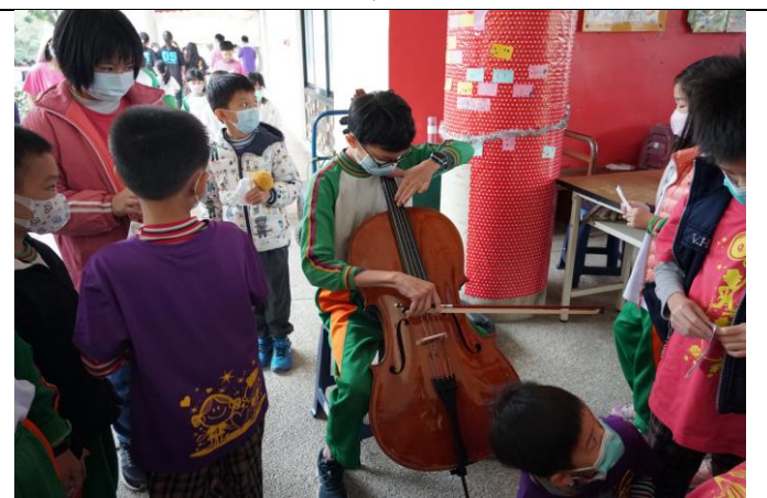
110. 12. 21 學生才藝秀活動