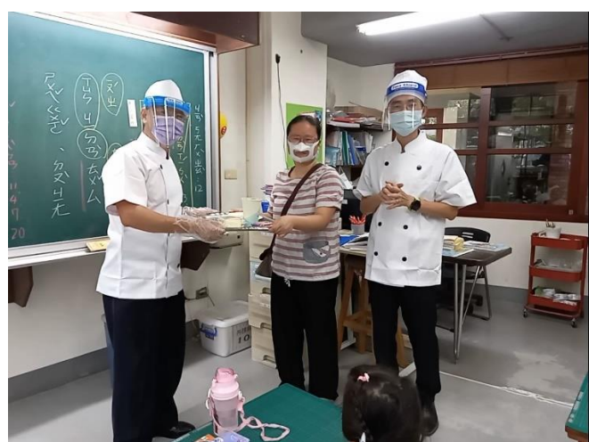
教師節活動-珍愛我的食尚老師