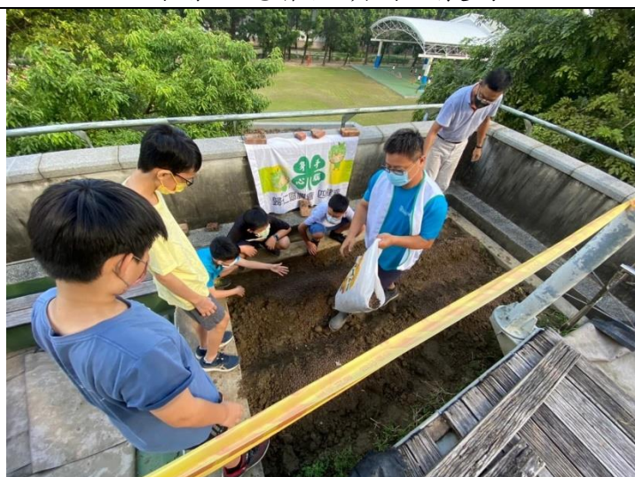
歸仁區農會四健會紅瓦厝小農夫班