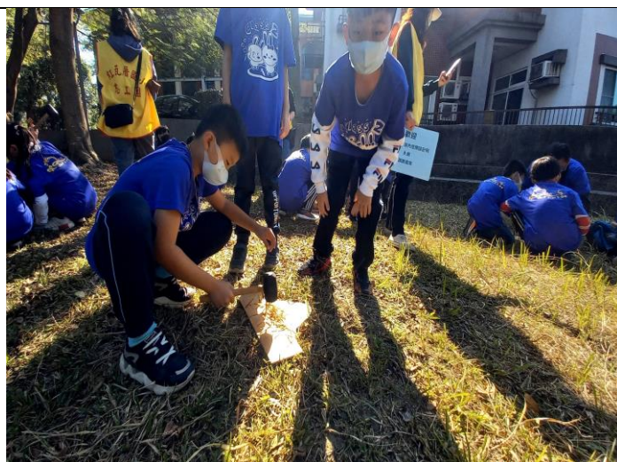
110. 12. 07 敦源祭孔健行闖關活動