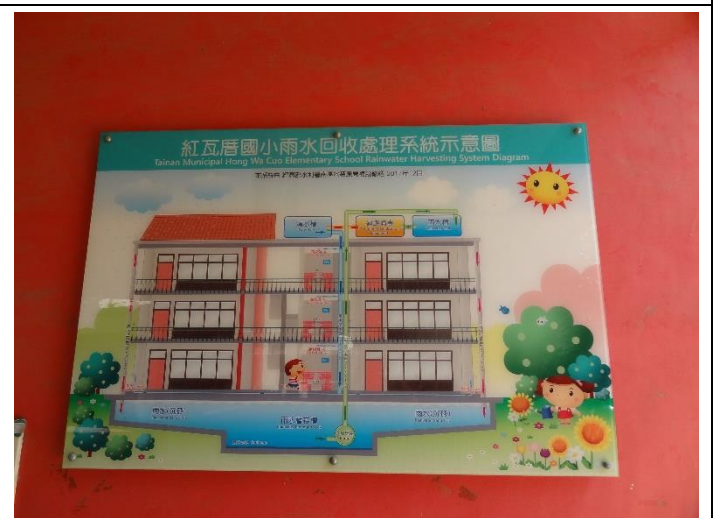
雨水回收處理系統示意圖