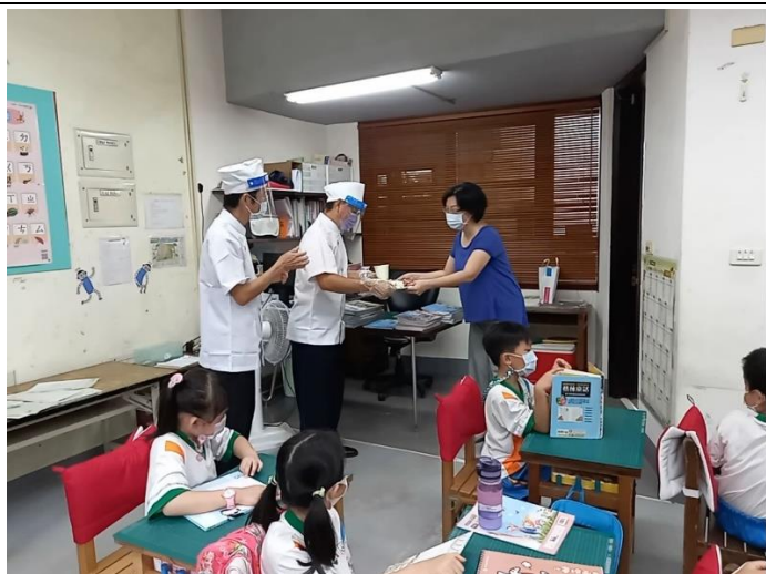
教師節活動-珍愛我的食尚老師