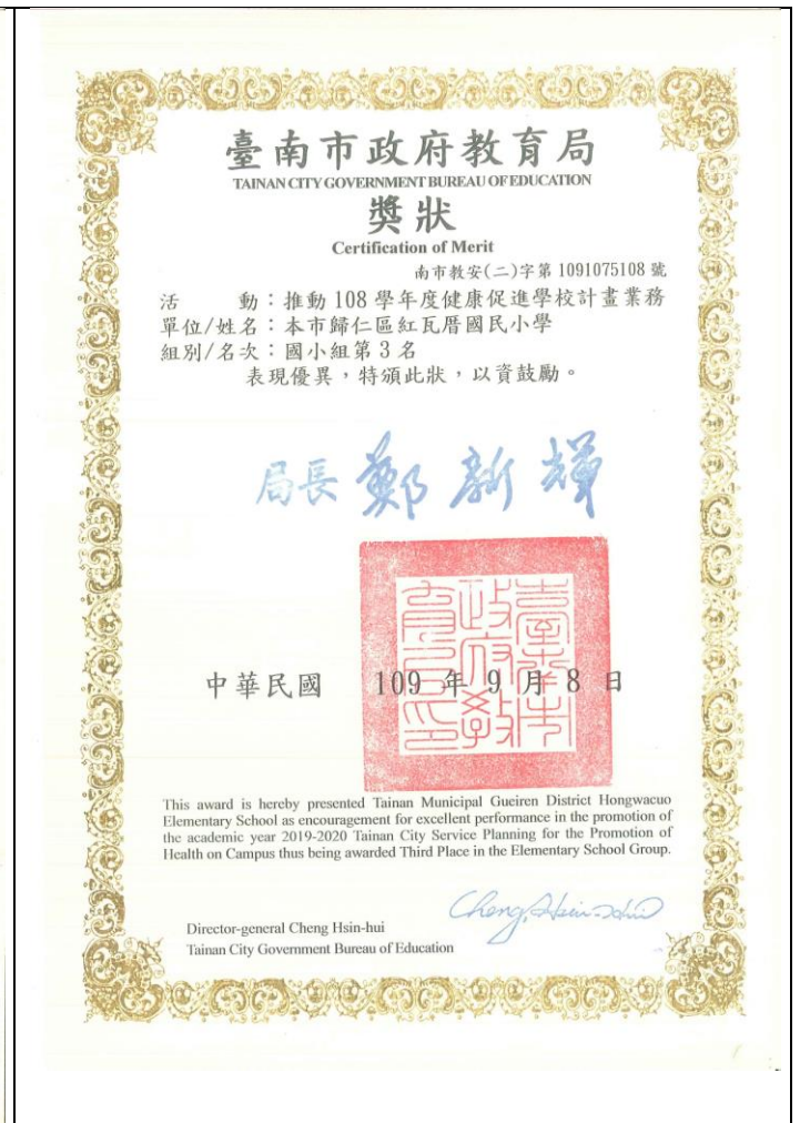
108 學年度健促績優學校評選第 3 名