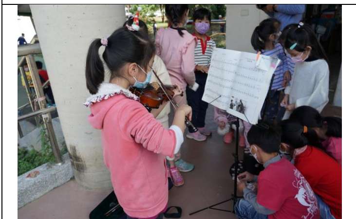
110. 12. 21 學生才藝秀活動