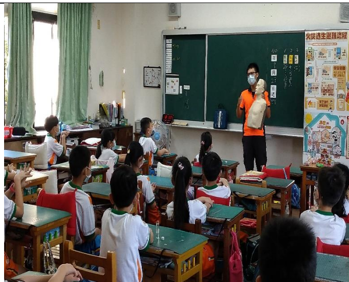
歸仁區消防隊防火急救宣導