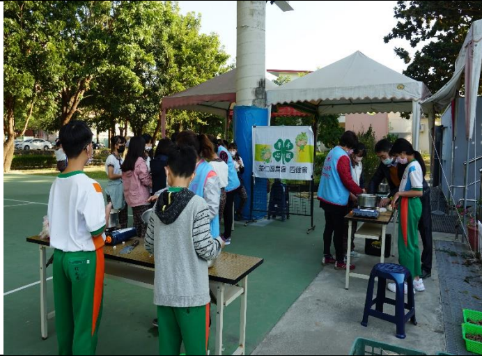
結合歸仁鄉農會食農教育-自種蘿蔔湯品