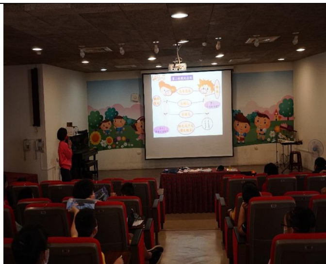
EASY SHOP 性教育宣講