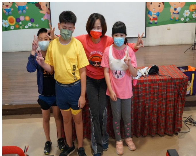
EASY SHOP 性教育宣講