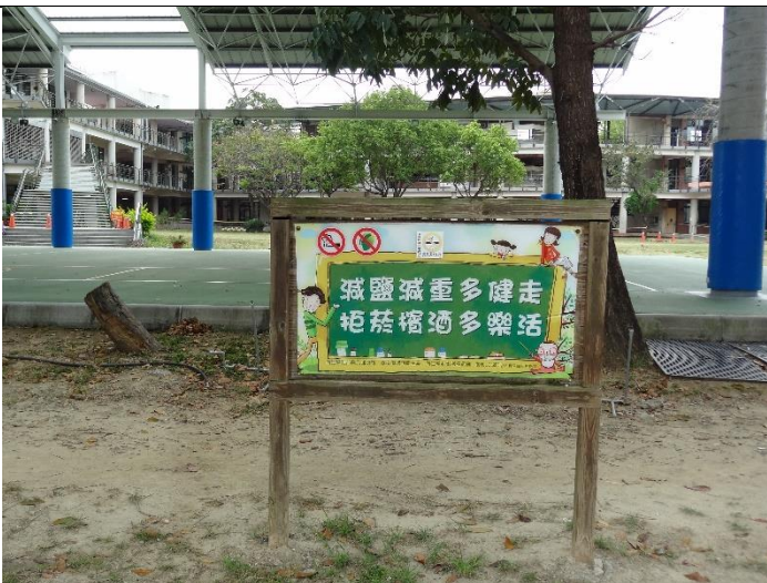
步道周邊設立健康促進宣導立牌