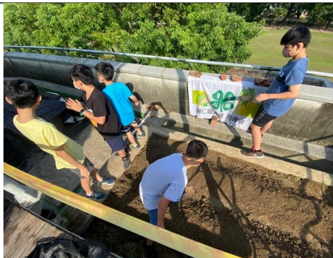
開闢紅瓦厝屋頂開心農場