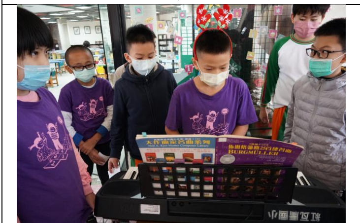
110. 12. 21 學生才藝秀活動