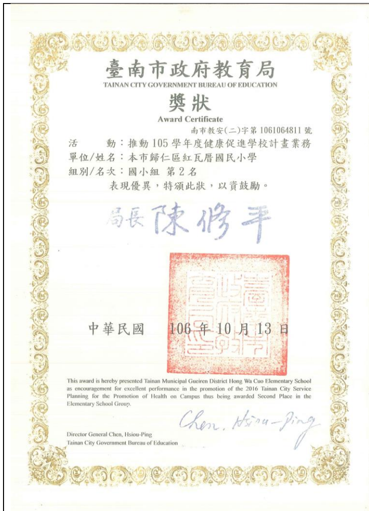
105 學年度健促績優學校評選第 2 名