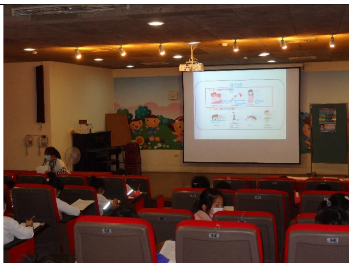
歸仁衛生所衛生教育宣導