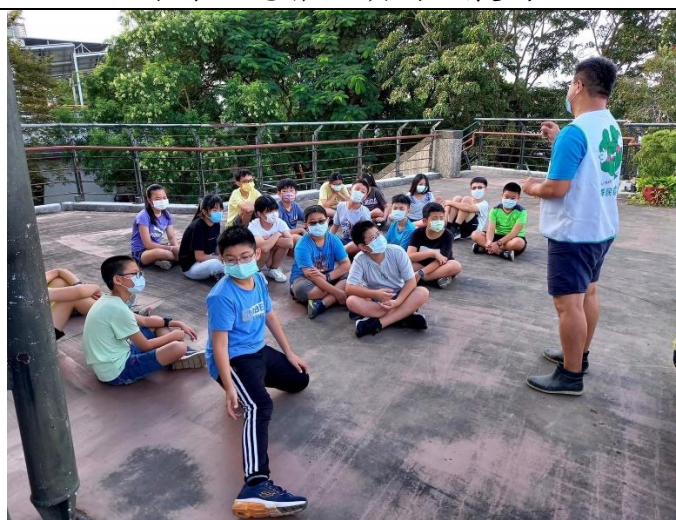
歸仁區農會四健會紅瓦厝小農夫班