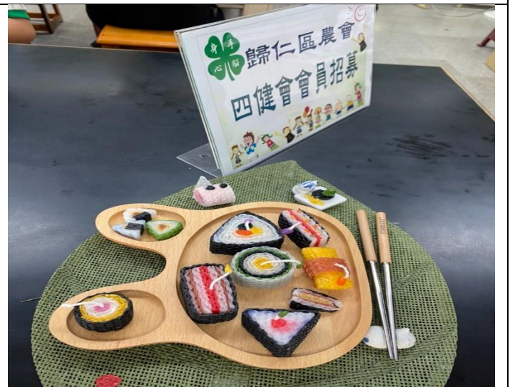
結合歸仁鄉農會畢業週活動 手作蜂蠟壽司謝恩師