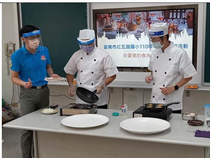
教師節活動-珍愛我的食尚老師 校長與會長製作美味營養三明治