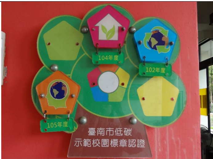
低碳示範校園標章-資源循環