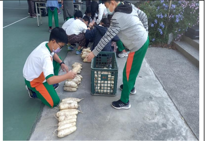
結合歸仁鄉農會食農教育-自種蘿蔔湯品