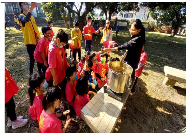
110. 12. 07 敦源祭孔健行闖關活動