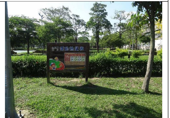
操場跑道周邊設立運動熱量立牌