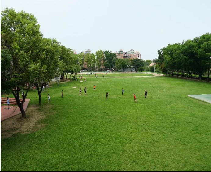
綠意盎然大草原，可舒緩疲勞眼睛