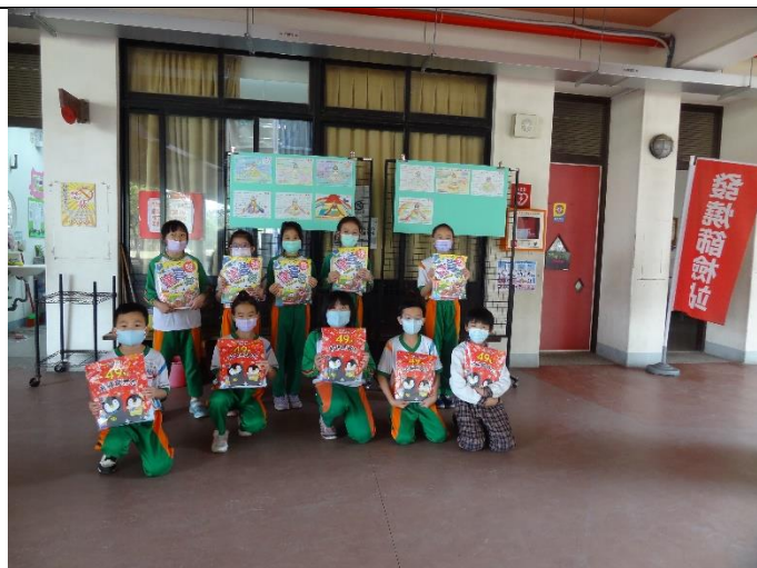
健康吃快樂動金國王著色比賽