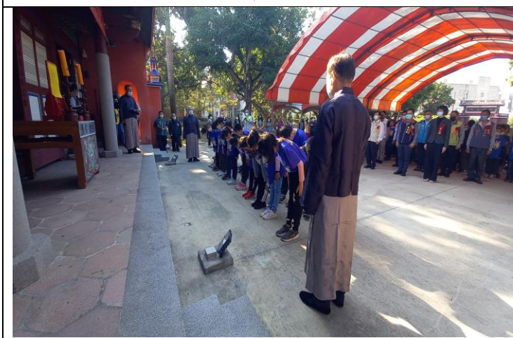
110. 12. 07 敦源祭孔健行闖關活動