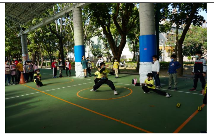
110. 12. 21 學生才藝秀活動