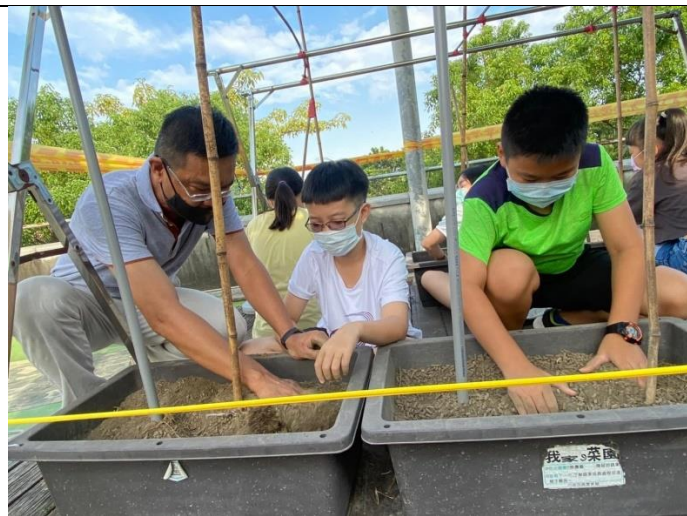
開闢紅瓦厝屋頂開心農場