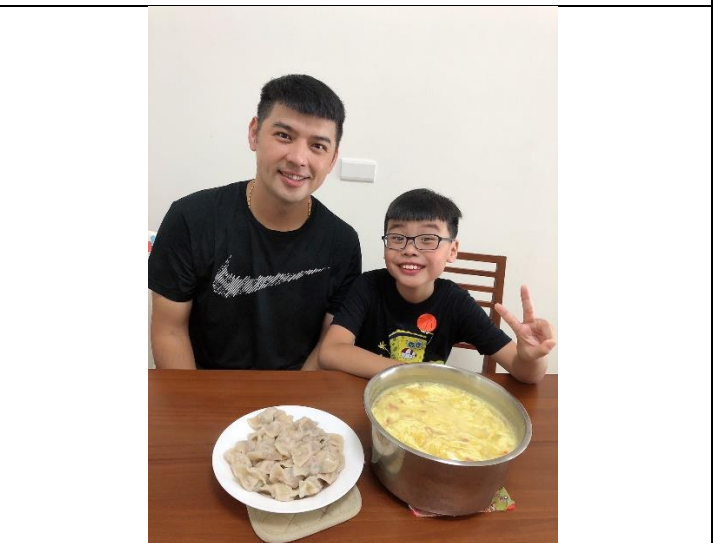
結合歸仁鄉農會、崑山科技大學 親子共廚活動