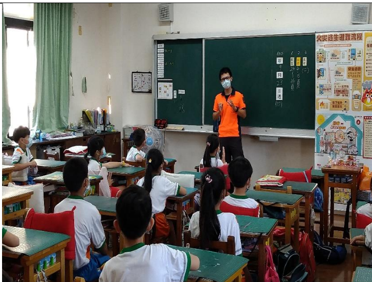
歸仁區消防隊防火急救宣導