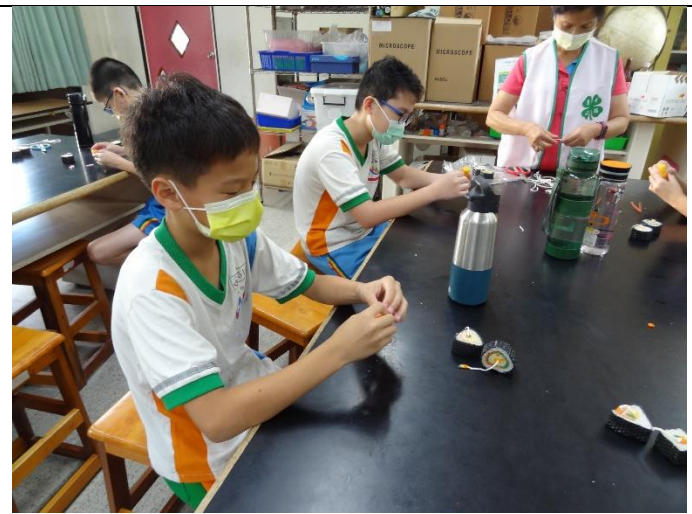
結合歸仁鄉農會畢業週活動 手作蜂蠟壽司謝恩師